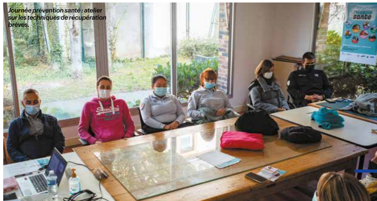
Journée prévention santé : atelier sur les techniques de récupération brèves.

En matière de prévention, la MGP peut aussi compter sur la force de son réseau d'élus. Formés aux risques psychosociaux (RPS), ils détectent les signes de mal-être de leurs collègues et agissent en conséquence. La lutte contre le suicide est renforcée par la participation de la MGP au comité de pilotage de la Journée nationale de prévention du suicide de l'Union nationale de prévention du suicide (UNPS).