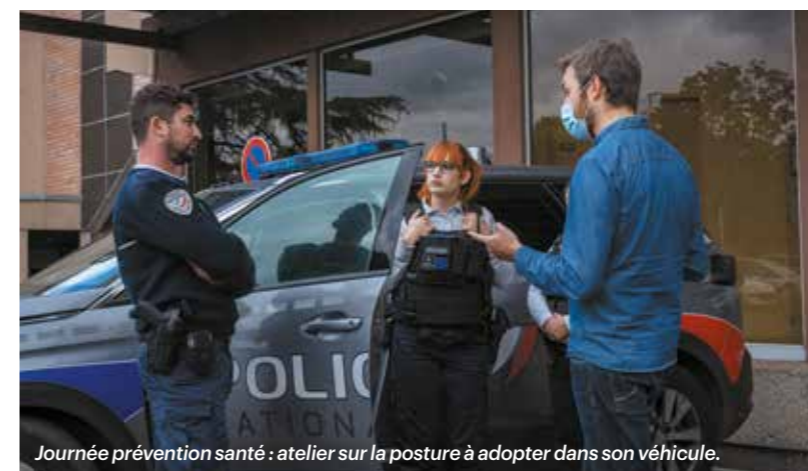
Journée prévention santé : atelier sur la posture à adopter dans son véhicule.

Solidaire et attentive, la MGP met en œuvre de nombreuses actions de prévention pour faire évoluer les comportements en matière de santé. La mutuelle veille également à apporter un soutien adapté aux adhérents fragilisés.